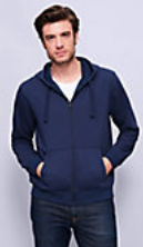
SOL'S SPIKE MEN 03105